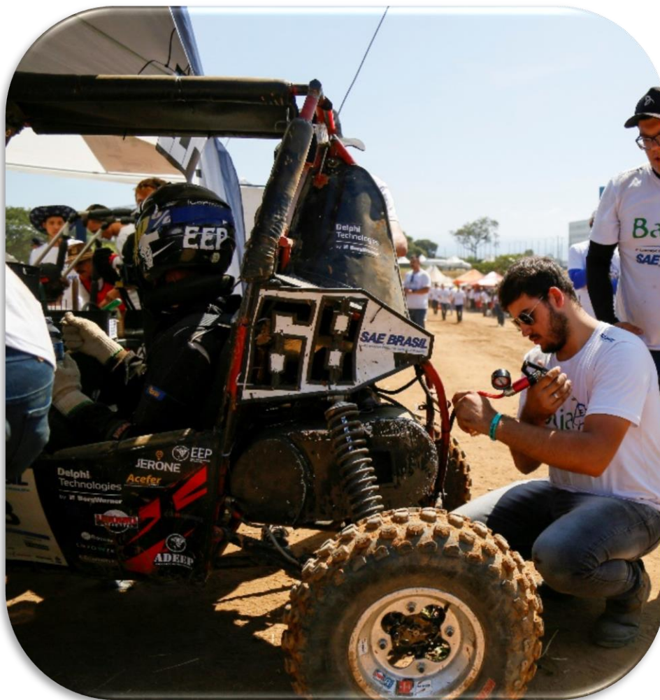
Momentos Nacional 2022